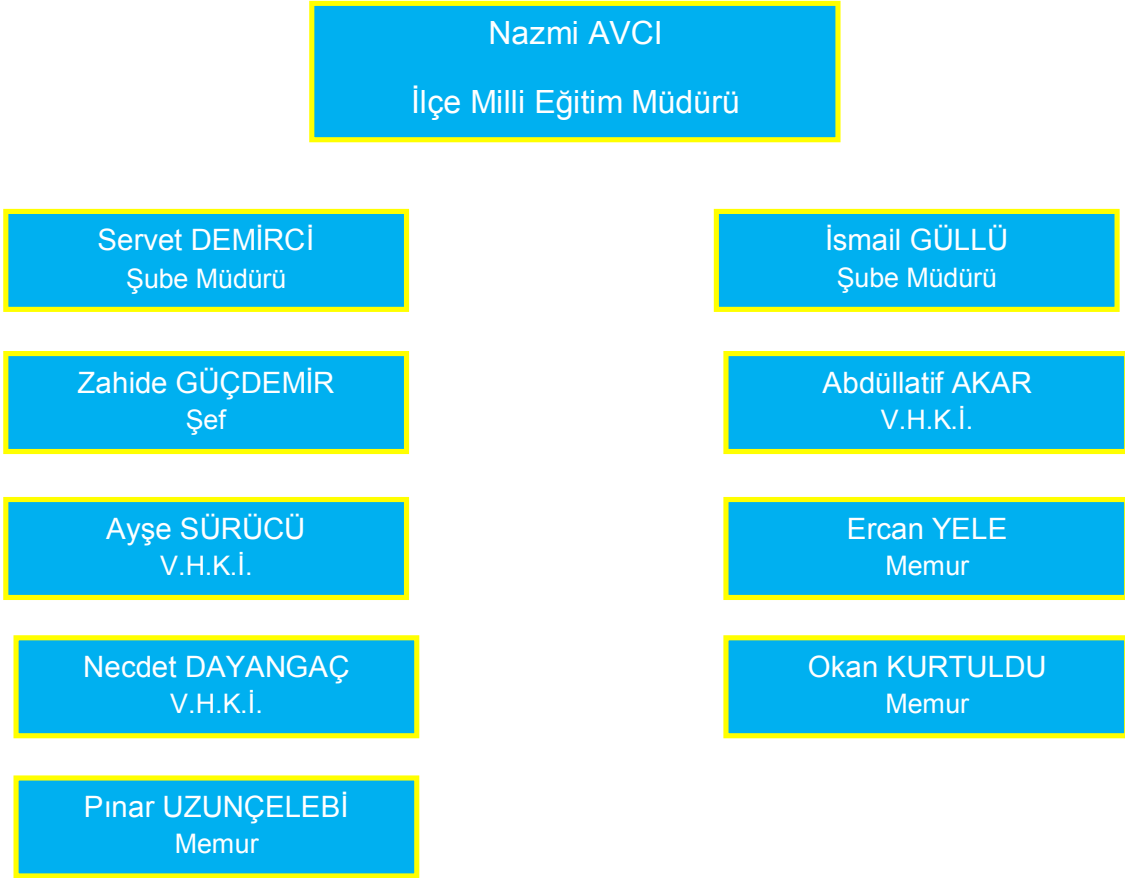
Şekil 2- Seyitgazi İlçe Milli Eğitim Müdürlüğü'nün Teşkilat Şeması

Seyitgazi İlçe Milli Eğitim Müdürlüğü teşkilatı ilçe milli eğitim müdürü, şube müdürleri, şef, V.H.K.İ. ve memurlardan oluşmaktadır.